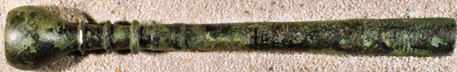
Bronzenes Mundstück einer römischen Trompete

Originale römische Fundstücke werden zu jeder Szene gezeigt.