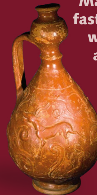
Krug aus Terra Sigillata Feine römische Keramik mit Barbotineverzierung

Man könnte fast glauben, wirklich im alten Rom zu sein.