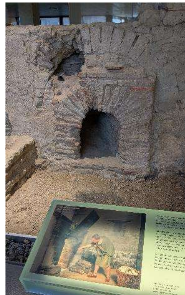
Eine außerhalb des Badegebäudes gelegene Heizstelle (Praefurnium) zum Erwärmen eines Warmwasserbeckens

Des Weiteren zeigte uns die Ausstellung, dass römische Thermen neben ihrer Funktion zur körperlichen Reinigung auch für das gesellschaftliche Leben von Bedeutung waren und gleichzeitig Orte antiker Wellness. Oftmals übten Ärzte in separaten Räumen ihr Handwerk aus.