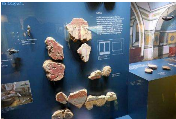
Reste der Wandbemalung und...