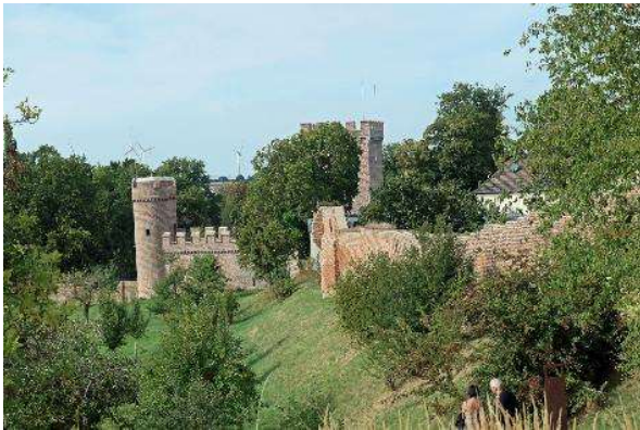
Die Stadtmauer Zülpichs aus Ziegelstein...

Die Zülpicher Stadtbefestigung in ihrer heute sichtbaren Form entstand nach 1370 n. Chr. unter dem Kölner Erzbischof Friedrich III. von Saarwerden und war 1394 n. Chr. abgeschlossen. Sie umfasste eine Stadtmauer aus Ziegelsteinen mit drei Türmen, die integrierte kurkölnische Landesburg, einen umlaufenden Graben und vier Tore an den Ausfallstraßen der Stadt. Mehrere bis zu 55 kg schwere Steinkugeln (Blidengeschosse), die im Stadtgebiet gefunden wurden, zeugen von den harten Belagerungszeiten Zülpichs im Dauerstreit des 13. und 14. Jhd. n. Chr. zwischen dem Herzogtum Jülich und dem Kölner Erzbistum. Auch während des 30-jährigen Krieges litt die Bevölkerung unter der Belagerung und schließlich der Eroberung durch hessische Truppen im Jahr 1642. Bei deren Abzug gingen alle vier Stadttore in Flammen auf.