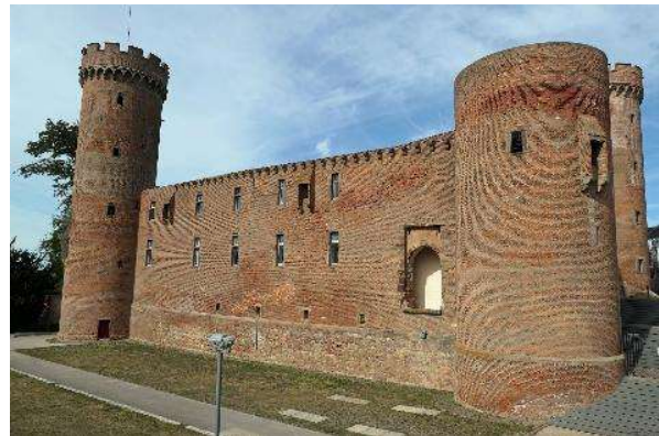
Die ziegelsteinbewehrte Landesburg Zülpichs.