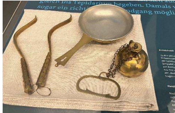
Typische Badeutensilien der Römer.

Die Bevölkerung nutzte das Badehaus nicht nur zum Baden, sondern auch als gesellschaftlichen Treffpunkt. Jede Stadt besaß ein solches Badehaus. Die Anzahl der Thermen war von der Größe der Siedlung und ihrer Einwohnerzahl abhängig. Oft wurde Wert auf eine luxuriöse Ausstattung gelegt. An der mehr oder weniger aufwändigen Gestaltung der Thermen ließ sich der Wohlstand des betreffenden Ortes ablesen. Wie ausgeprägt die Badelust der Römer auch auf dem Lande war, zeigte eine Unterabteilung in der Ausstellung: Sie beherbergt unter anderem das kostbare Inventar eines römischen Grabes aus Enzen in der Eifel.