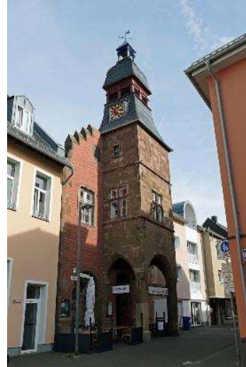
Das alte Rathaus von Zülpich.

Quer über den heutigen Marktplatz führte in römischer Zeit die Straße von Zülpich nach Neuss, die 2011 erstmalig im Stadtgebiet als Kiespflasterung und durch einen Straßengraben archäologisch nachgewiesen werden konnte. Dort zahlreich aufgefundene Weihesteine für den im Rheinland wichtigen Kult der Matronen belegen, dass sich im Stadtgebiet ein Matronentempel befunden haben muss. An den Ausfallstraßen befanden sich – wie damals üblich – die Gräberfelder der Stadt, von denen eines mit mindestens 300 Bestattungen im Bereich des heutigen Geriatriischen Zentrums lag.