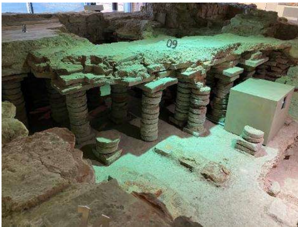
Reste der originalen Fußbodenheizung.