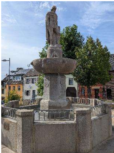
In Gedenken an die Schlacht des Frankenkönigs Chlodwig gegen die Alemannen: Derselbe auf dem Brunnen am Marktplatz in Zülpich.