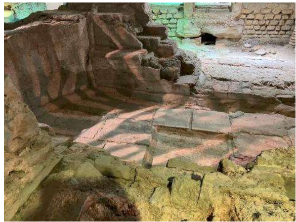
Reste antiker Wasserbecken...