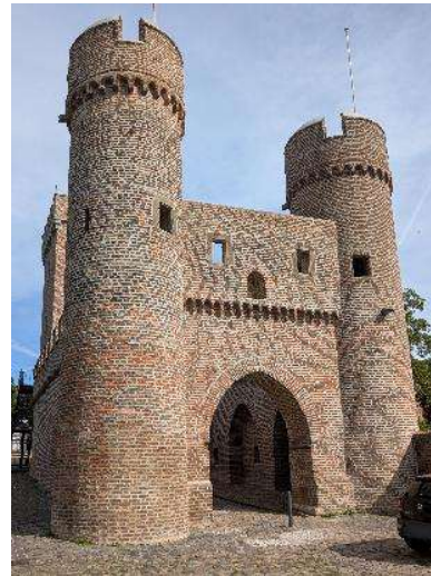
... mit erhaltenem Stadttor.