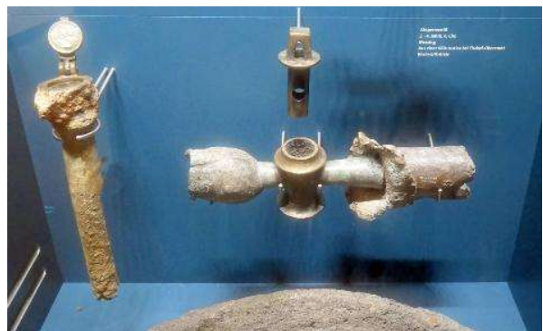
... Teile der Wasserversorgung...