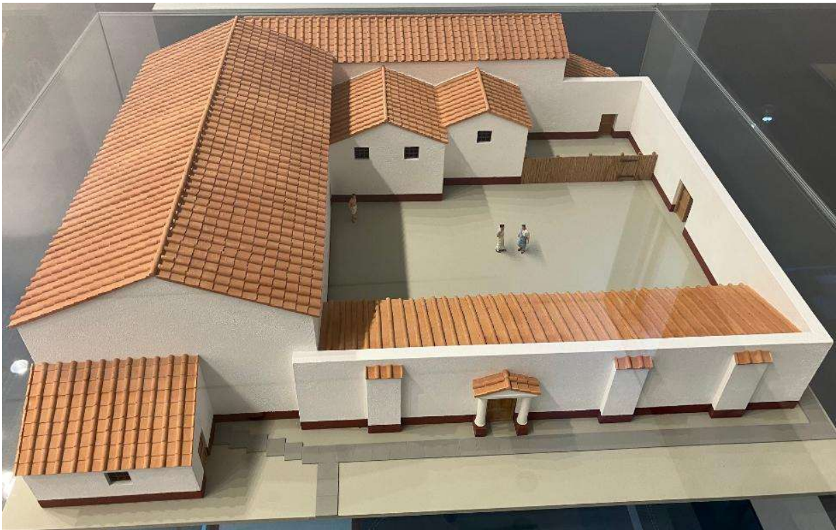
Die Therme von Tolbiacum im Modell in ihrer letzten Ausbauphase im 4. Jhd.

Seit 2008 zeigt das Museum der Badekultur in Zülpich die Kulturgeschichte des Badens in einer europaweit einzigartigen Ausstellung. Ausgehend von der besterhaltenen römischen Thermenanlage ihrer Art nördlich der Alpen schlägt die Ausstellung einen Bogen von der Antike bis in die Gegenwart. Eine anschauliche Inszenierung, verbunden mit interessanten Hintergrundinformationen, lädt zu einer ebenso informativen wie kurzweiligen Reise durch die Geschichte des Badens ein. Die Palette der gezeigten Objekte reicht von römischen Toilettenartikeln über die Einrichtung einer mittelalterlichen Badestube bis zur Entwicklung des Badewesens im 19. Jhd. und des Badedesigns der 1950er bis 1970er Jahre.