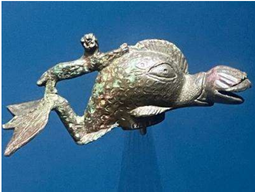
... mit wasserspeiendem Delphin.