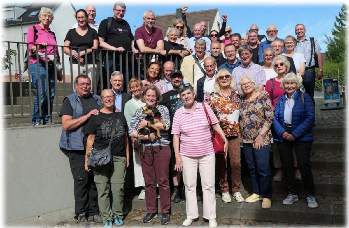
Die Teilnehmerinnen und Teilnehmer an der Exkursion des FöVe. Saalburg e.V. 2025 in Zülpich (NRW)